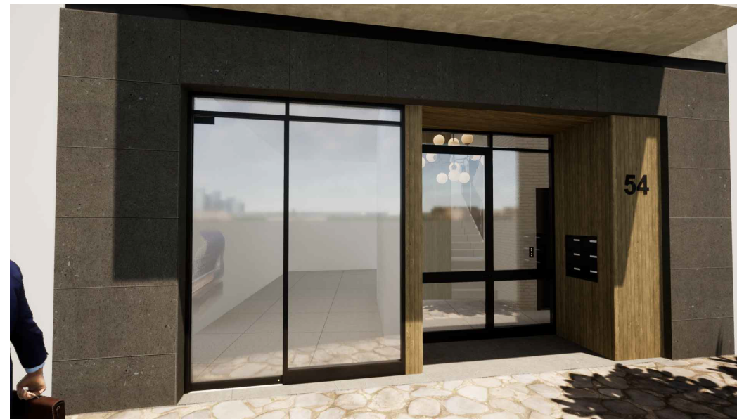
Fachada en planta baja